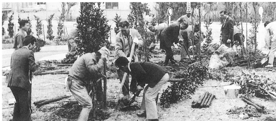
豊公園交通公園にて

緑化都市を宣言している長浜市に於て明るい緑の街を建設するため“住みよい緑の街づくりの会”が結成された。豊公園を中心にその計画が多くの市民及び団体によって緑化運動が推進されているが、当クラブも認証状伝達式の記念事業として、これに協賛したのを契機に今後これを継続的に行うことになった。このためこの運動を湖北一市三郡の私達の住む地域におし広めるためにみどりの森特別委員会を設置した。資金は会員の慶事の際、特別寄付をお願い致し、この積立金をもって運用する。